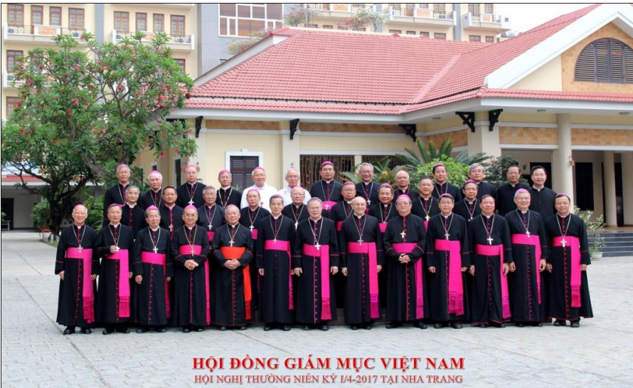
HỘI ĐỒNG GIÁM MỤC VIỆT NAM HỘI NGHỊ THƯỜNG NIÊN KỶ I/4-2017 TẠI NHA TRANG